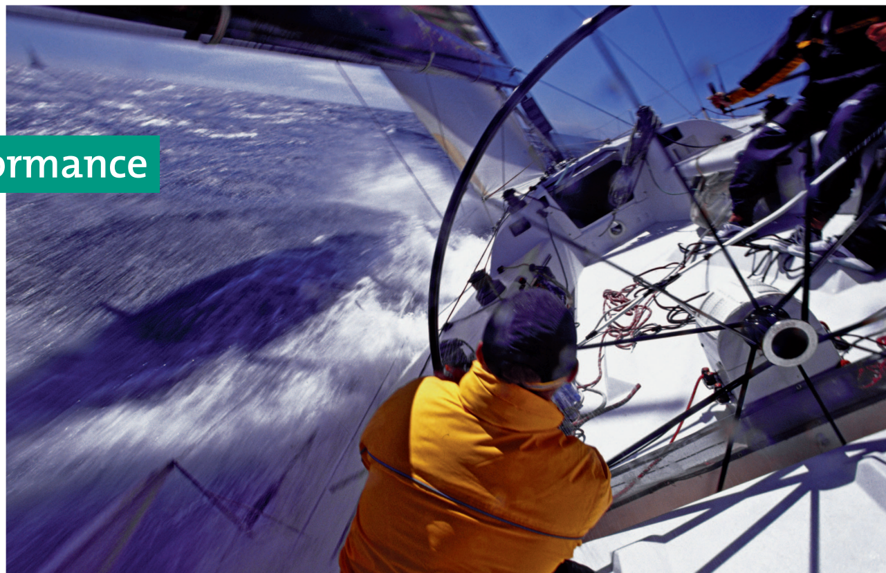
Das Ruder fest in der Hand: Steuern Sie Ihr Unternehmen in eine erfolgreiche Zukunft.