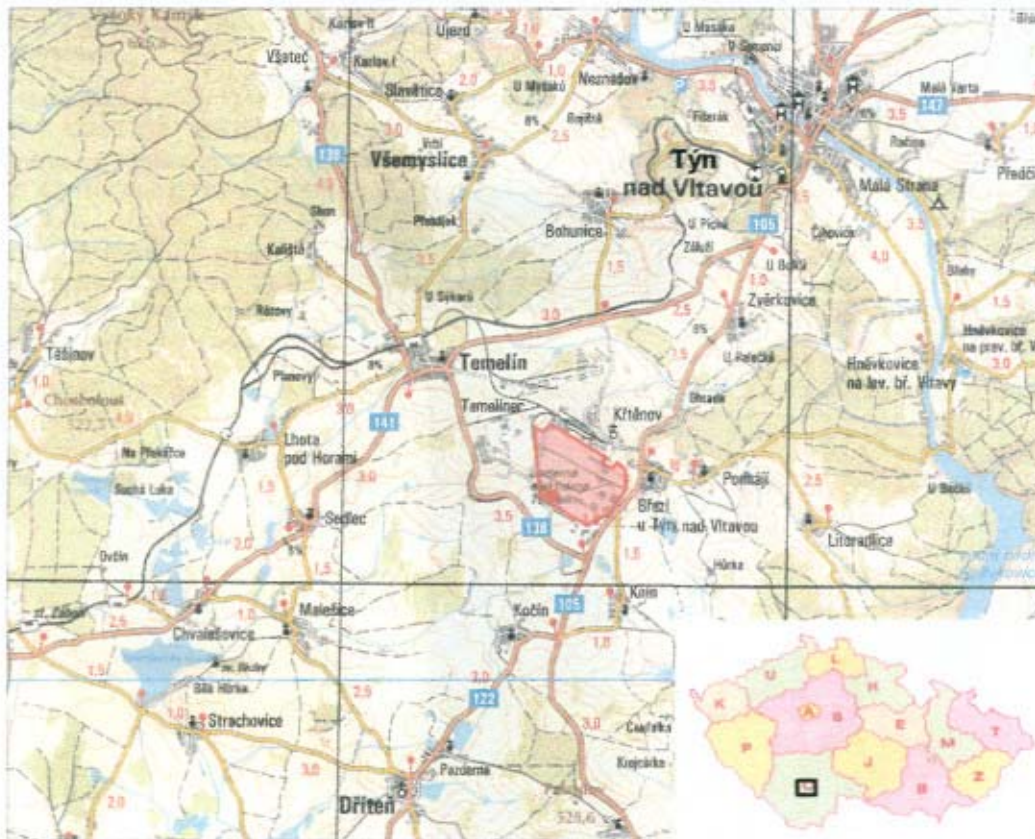
Abb.: Die Standortbestimmung des Geländes von AKW Temelin mit der Bezeichnung der Lage des Lagers (Maßstab 1:100 000)