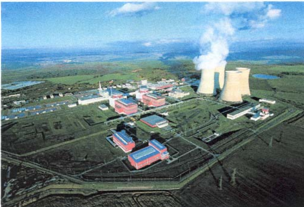
Abb.: Blick auf das Gelände des AKW Temelin mit dem Modell des Brennelementbehälterlagers

Im Vordergrund das Lagerobjekt, dahinter Maschinenhaus zur Wärmeableitung und Wasserbehälter, ferner zwei Hauptproduktionsblöcke und das Gebäude der Hilfsbetriebe. Rechts Kühltürme, davor chemische Wasseraufbereitung.