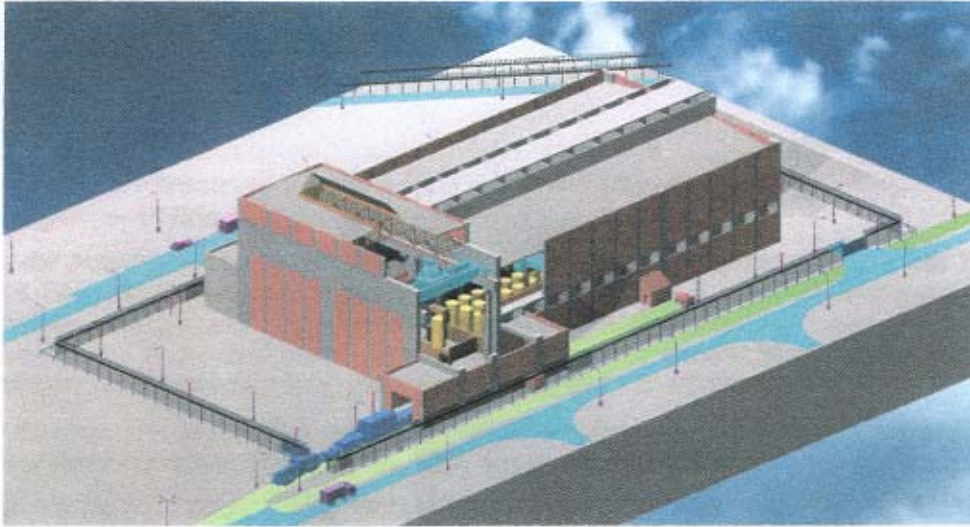
Abb.: Modell des Lagergebäudes

Die gesamte Standortbestimmung des Lagers auf dem Kraftwerksgelände ist aus dem folgenden Bild ersichtlich: